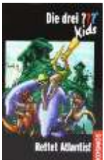
Die drei ??? Kids Rettet Atlantis!, aus dem KOSMOS Verlag