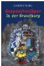
Gespensterjäger in der Gruselburg, von Cornelia Funke