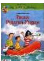
Pauls Piraten-Ferien, von Charlotte Habersack