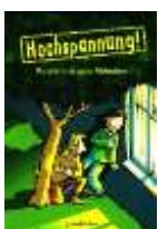
Hochspannung! Ratekrimis zum Abheben, aus dem gondolino Verlag