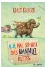
NUR MAL SCHNELL DAS MAMMUT RETTEN, von KNUT KRÜGER