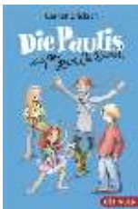
Die Paulis außer Rand & Band, von Gernot Gricksch